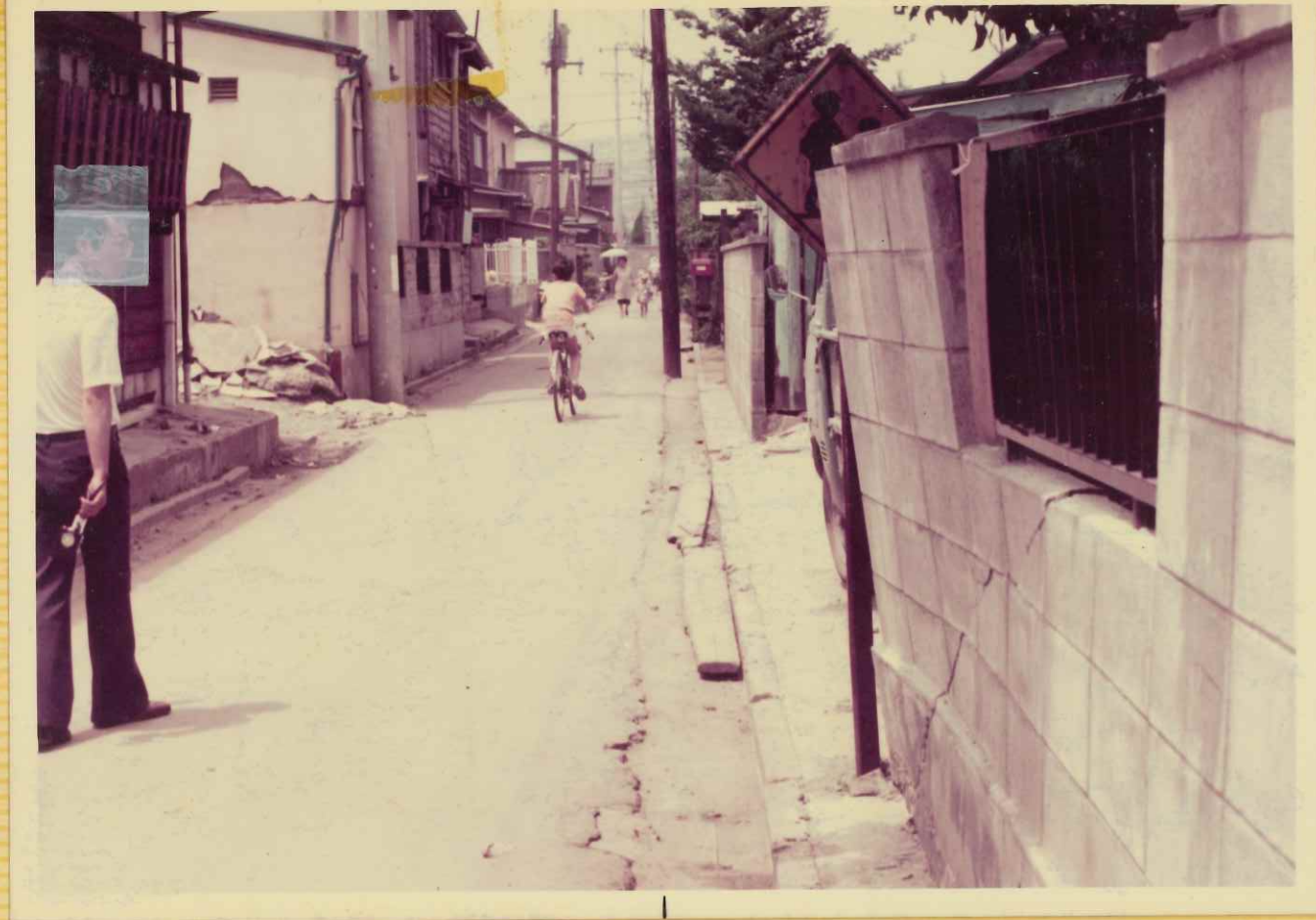
ブロック塀の端部が 振られて破損 「控之壁なし」