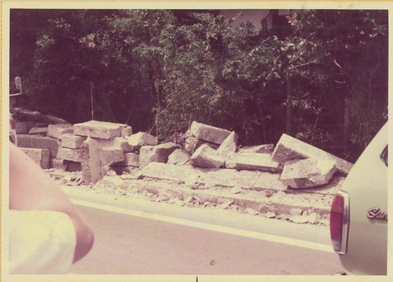
大谷石積塙の 崩壊