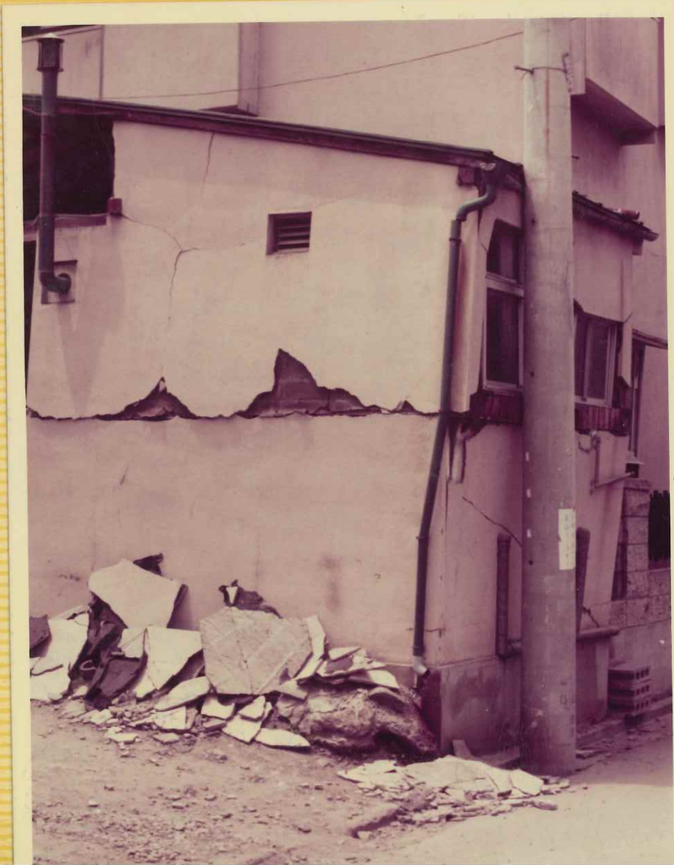
コンクリートブロック上部が 木造 電柱で倒壊をまぬ かれる。