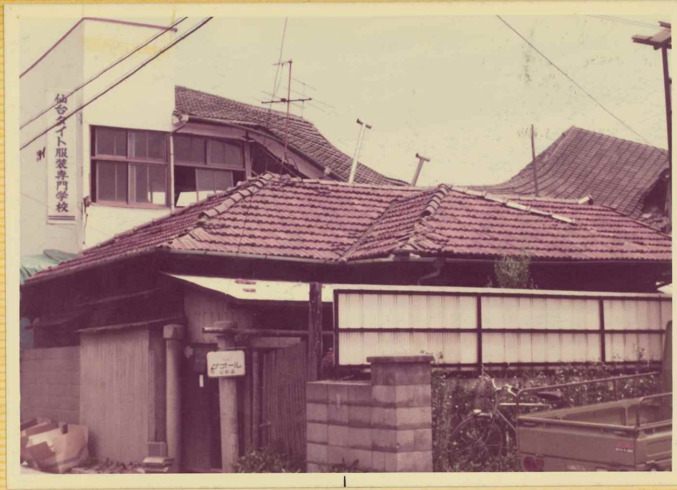
セメント瓦屋根・桁の破 損で 2階崩壊 (仙台外服装専門学校) その1.